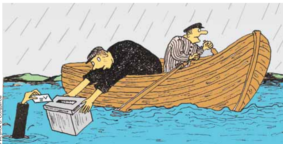
Рисунок В. Солдатов

Не все участники выборного процесса готовы фальсифицировать итоги выборов или покрывать подобные действия. Не у всех еще атрофировалась совесть.